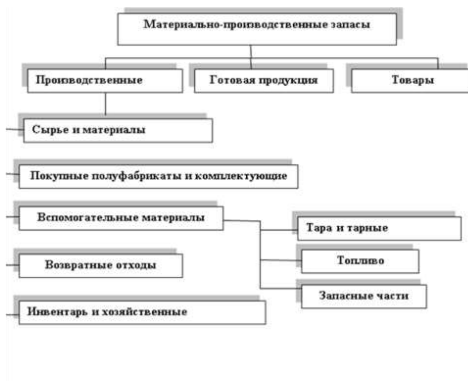
Рисунок 1 – Классификация материально-производственных запасов в организациях АПК

Материально-производственные запасы как важнейшие активы организаций агропромышленного комплекса (АПК) на сегодняшний день выступают главным фактором обеспечения бесперебойной и эффективной деятельности. На рисунке 1 представлена классификация материально-производственных запасов в организациях сферы АПК.