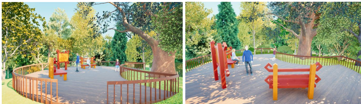
Рисунок 6 – Визуализация центральной зоны векового дуба.

Стенд и скамейки, по цвету, выполнены из красной и желтой цветовой гаммы, как из мотивов в марийском орнаменте.