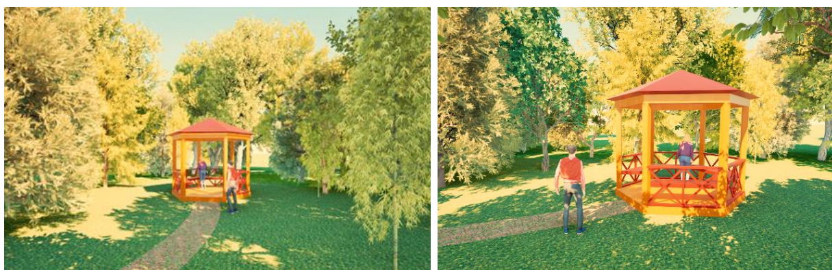
Рисунок 7 – Визуализация зоны отдыха.

Последняя зона – зона отдыха с беседкой (рисунок 7). Беседка выполнена в таком же стиле, как и все остальные МАФ. Это зона может стать идеальным местом для посиделок, наслаждения с природой.