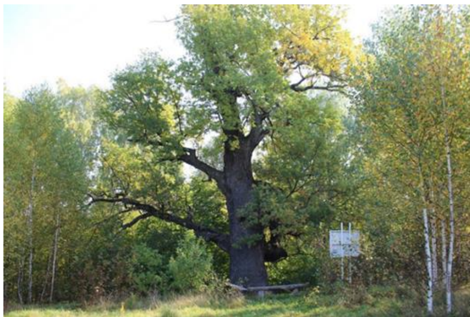
Рисунок 1 – Вековой дуб Степана Разина.

Горномарийский район в Республике Марий Эл славится множеством интересных мест, одним из них является вековой дуб (рисунок 1), расположенный на окраине деревни Запольные Пертнуры, около реки Юнга. Вековой дуб является современником легендарного Акпарса. По местным легендам сам Акпарс отдыхал под этим деревом и набирался сил перед своими походами. Поэтому, местные его прозвали дубом Акпарса, но есть и второе название – дуб Степана Разина. По легендам, около этого дуба останавливался отряд Степана Разина. Местные марийцы считают дуб одним из священных, и часто «заряжаются» природной энергией от него. Дуб является местной достопримечательностью и является памятником природы [1-2].