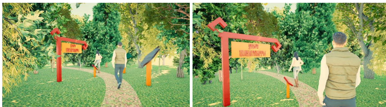
Рисунок 5 – Визуализация входной зоны.

Вывеска и указатель сделаны в марийском стиле, а информационные стенды напоминают очертания желудя и листьев дуба (рисунок 5). Была разработана визуализация для этой зоны, создавалась в программе Archicad и Twinmotion.