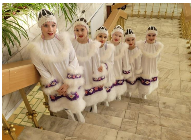
Рисунок 2 – Образцовый ансамбль танца народов мира «Мечта» в лицах.

Ключевая цель деятельности коллектива – формирование личности ребенка через сохранение и развитие народного творчества, воспитание уважения к культурному наследию, укрепление межнациональных связей и дружбы (рисунок 3).