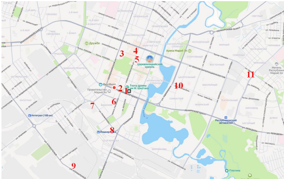
Рисунок 1 - Расположение участков сбора семян туи западной на карте г. Йошкар-Олы.