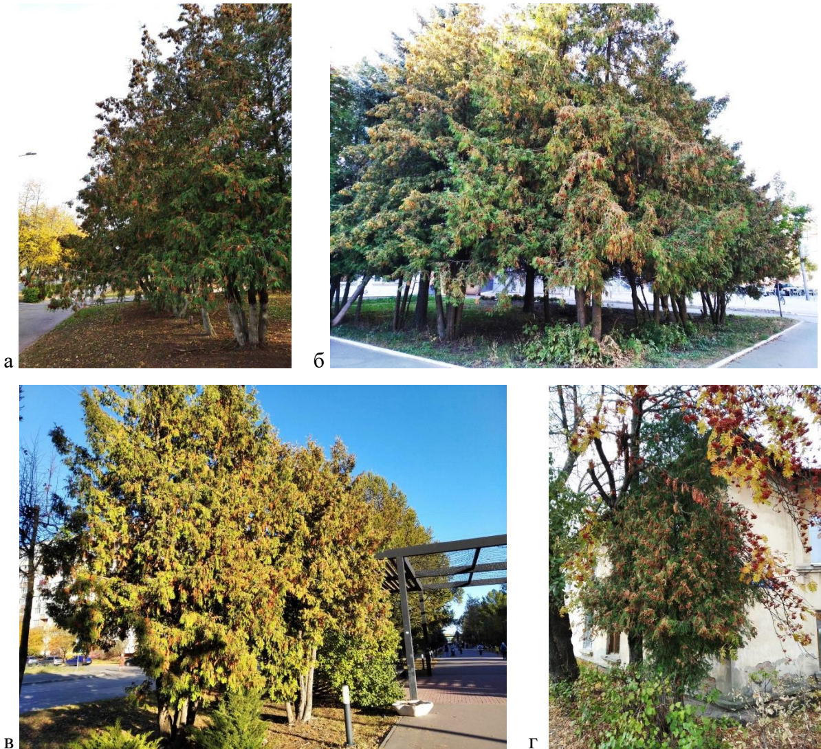
Рисунок 2 - Общий вид туи западной на участках: а – 3; б – 7; в – 10; г – 11.