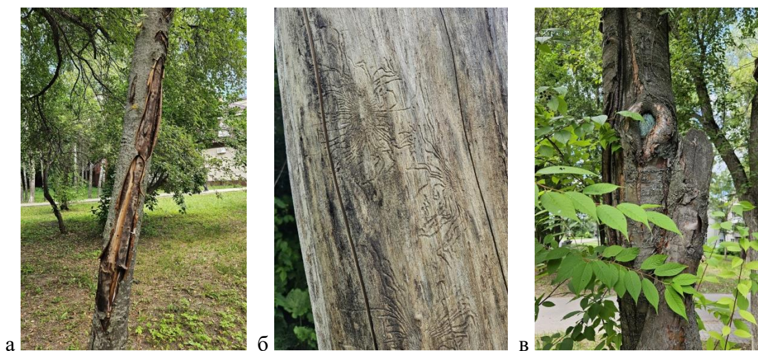
Рисунок 2 – Примеры повреждений стволов деревьев: а) некроз коры рябины обыкновенной, б) следы короеда на вязе, в) сухобокость и сучковые дупла на черемухе Маака.

Рябины обыкновенной в сквере насчитывается 25 экз., у половины растений состояние сильно ослабленное (категория 3), также имеются 2 усыхающих растения (категория 4) и 4 погибших (категория 5). Ранее снижение жизненного состояния рябин нами было выявлено и на других городских объектах [2, 5]. На большинстве рябин имеются признаки некрозно-ракового поражения стволов, которому, как известно [6], они часто подвержены и по причине которого в дальнейшем усыхают (рисунок 2а).