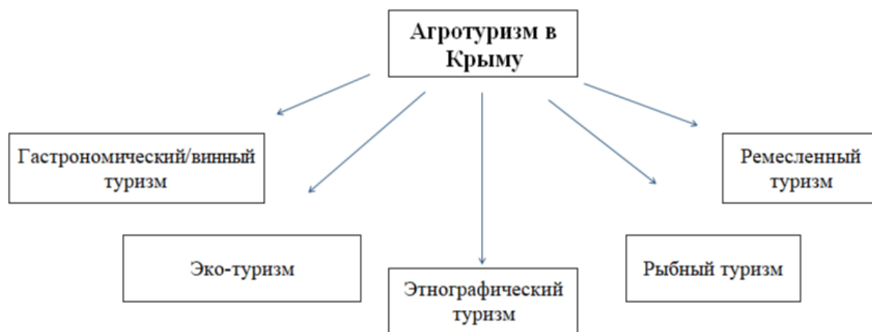
Рисунок 1 – Направления агротуризма в Крыму.

Природное разнообразие полуострова обусловило формирование нескольких ярко выраженных агротуристических зон (рис 1).