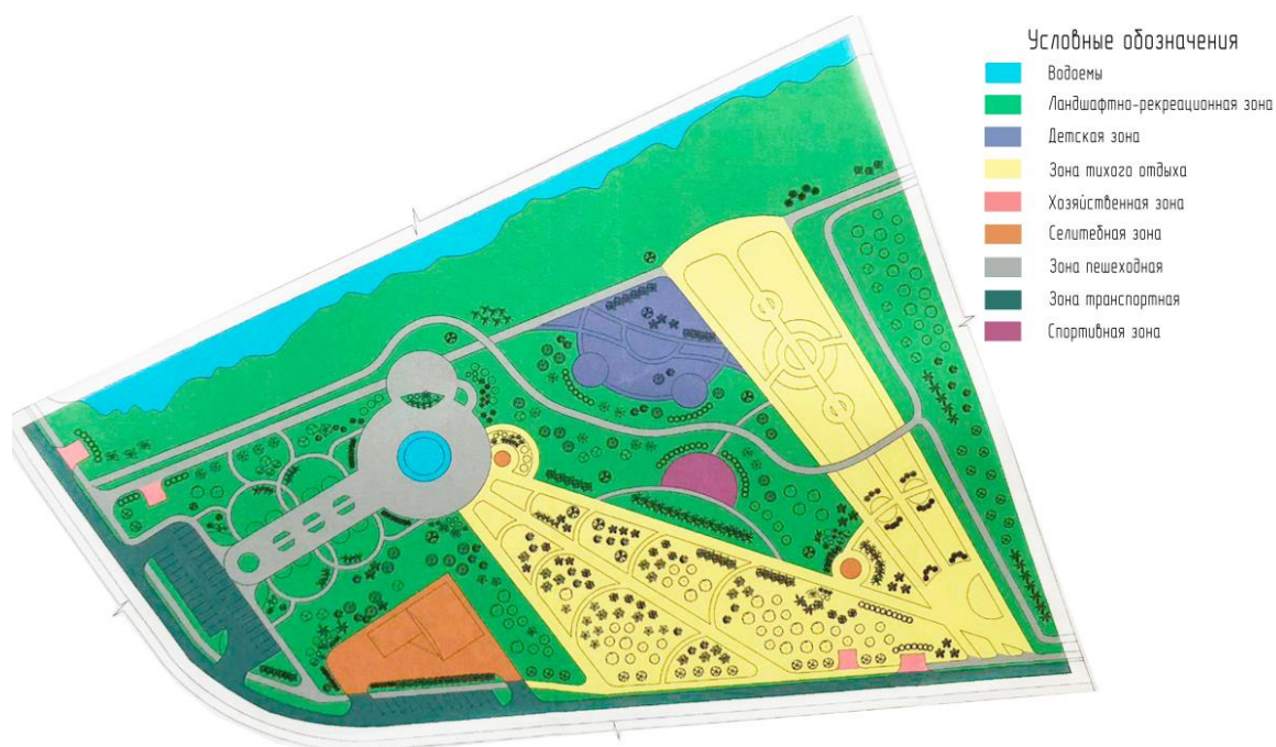
Рисунок 1 – Функциональное зонирование территории.

Проектируемая территория располагается в юго-западной части города Мичуринска, Тамбовской области в микрорайоне Громушка, на улице Калининской возле одного из прудов. С одной стороны, проектируемую территорию ограничивает дорога местного назначения, а с другой располагается небольшой пруд. Проектом предусмотрено организация 9 функциональных зон (рис. 1, табл. 1).