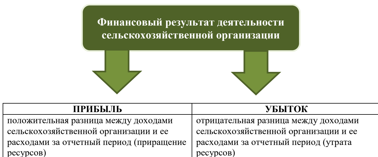
Рисунок 1 – Виды финансового результата сельскохозяйственной организации

Финансовая результативность деятельности сельскохозяйственной организации может быть представлена и в качестве прибыли, и в качестве убытка (рисунок 1).