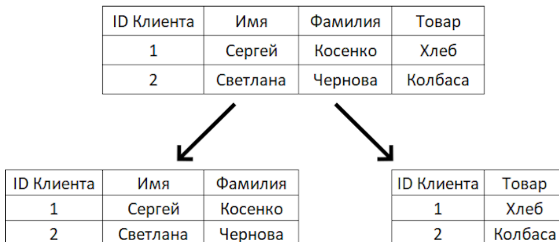
Рисунок 1 – Вертикальное шардирование одной верхней таблицы на две нижние.